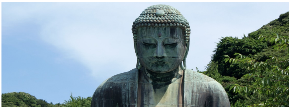
Bouddha - La Légende dorée .

Un destin unique marqué au sceau de la spiritualité